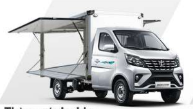
Thùng cánh chim