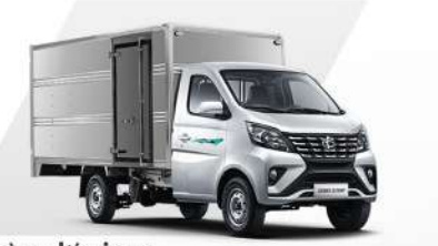
Thùng kín inox