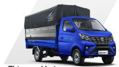
Thùng mui bạt

Đa dạng loại thùng cho nhiều mục đích vận chuyển khác nhau, nổi bật với kích thước thùng hàng siêu dài, giúp chuyên chở khối lượng hàng hóa lớn nhất trong phân khúc tải nhỏ máy xăng, tối ưu hiệu quả kinh doanh.