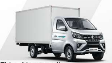
Thùng kín composite